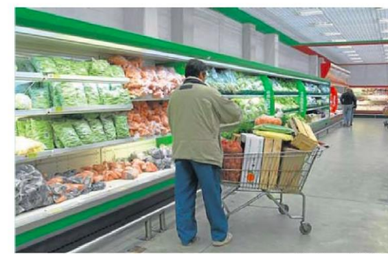
Después de la pandemia, los consumidores prefieren los canales virtuales, aunque muchos productos son adquiridos en supermercados o tiendas de barrio.

Según expertos, la importancia o influencia de los consumidores radica en que sus decisiones de compra afectan la demanda y por consiguiente la oferta de productos o servicios en el país. No obstante, este indicador anda a la baja en estas fechas.