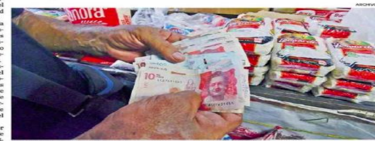
Las inflaciones en 2022 crecieron en una vertiginosa anual de 12,12%, lo más alto del siglo.

13,12 Fue el porcentaje de la inflación anual en Colombia para el 2022, comparada con la del año del 2021, según el DANE.