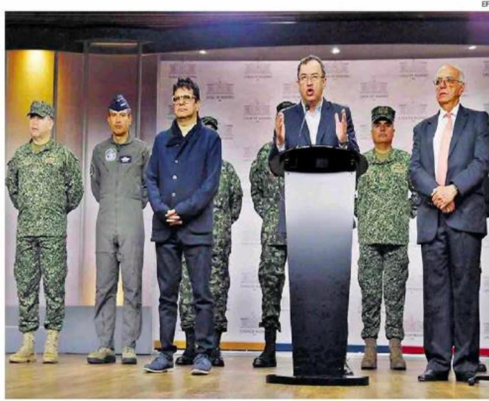
El anuncio del pasado miércoles del portavoz del Gobierno acerca de la suspensión del decreto con el ELN.

Quizá el desconcertante desmarque del ELN del cese el fuego ha sido anunciado por el propio presidente Gustavo Petro previamente sacó de los reflectores el gran reto que sugiere el intento de silenciar los fuegos de los otros grandes grupos armados ilegales y criminales del país: las disidencias de la FARC, los desertores de la Segunda Marquetalia, el Clan del Golfo y las Autodefensas de la Sierra Nevada. Por ello, EL HERALDO les preguntó a varios expertos si ven realizable este primer paso de la política de la paz total o si, por el contrario, complicará las cosas. Los analistas indicaron que aunque el suelo de estas comunidades golpeadas por la violencia es poder vivir un poco más en paz, sin crímenes, masacres, desplazamientos y confinamientos, el asunto no será fácil por múltiples factores.