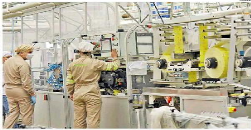
La actividad económica en el país se proyecta a mediana expectativa de crecimiento para el primer trimestre de 2023, según el Banco de la República.

Los especialistas coinciden en que 2022 pasará con un saldo de desaceleración económica que obliga a reajustar el consumo y buscar bienes sustitutos. Expertos recomiendan reajustar el consumo y buscar bienes sustitutos.